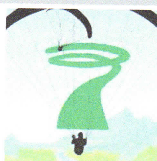
Thermik: Das erste in der Thermik kreisende Fluggerät gibt die Drehrichtung für alle vor.