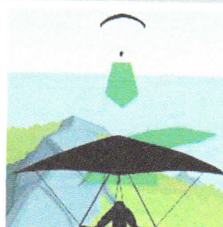
Soaren oberhalb des Hangs: Das Fluggerät mit dem Lee an der linken Seite weicht nach rechts aus.