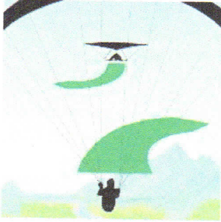
Gegenkurs: Beide Fluggeräte weichen nach rechts aus.