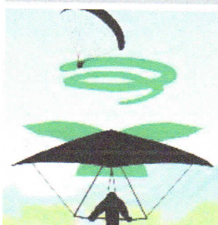
Thermik: Im Aufwind kreisenden Fluggeräten muss ausgewichen werden. Aber: Am Hang haben die Hangflugregeln Vorrang!