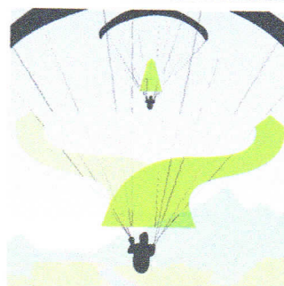
Überholen: Mit sicherem Abstand rechts. Nur wenn rechts nicht möglich, mit sicherem Abstand links.

In Europa fehlt bisher eine verbindliche gemeinsame gesetzliche Grundlage für Ausweichregeln beim Thermikfliegen und Hangsoaren für Gleitschirm- und Drachenflieger. Der Europaverband der Gleitschirm- und Drachenflieger (EHPU) hat deshalb die wichtigsten gemeinsamen Regeln, die in allen Ländern gültig sind, zusammengefasst. Es ist jedoch zu beachten, dass die Regeln zum Thermikfliegen und Hangsoaren in einigen Ländern nur als Empfehlung des nationalen Pilotenverbandes angesehen werden können, nicht als gesetzliche Vorschrift. Grundsätzlich empfiehlt die EHPU, sich bei Flügen im Ausland auf den Websites der nationalen Pilotenverbände über die Flugregeln zu informieren. www.ehpu.org