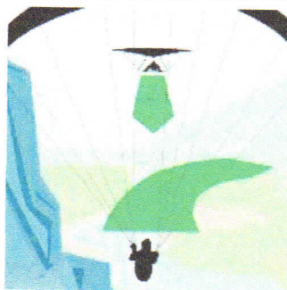
Soaren am Hang: Das Fluggerät mit dem Hang an der linken Seite weicht nach rechts aus.